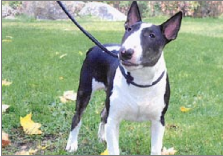
Taavia muistellen. Koirakerhon väki

Syyskokouksessa 20.10.2003 valittu Katri Valan puiston koirakerho ry:n hallitus